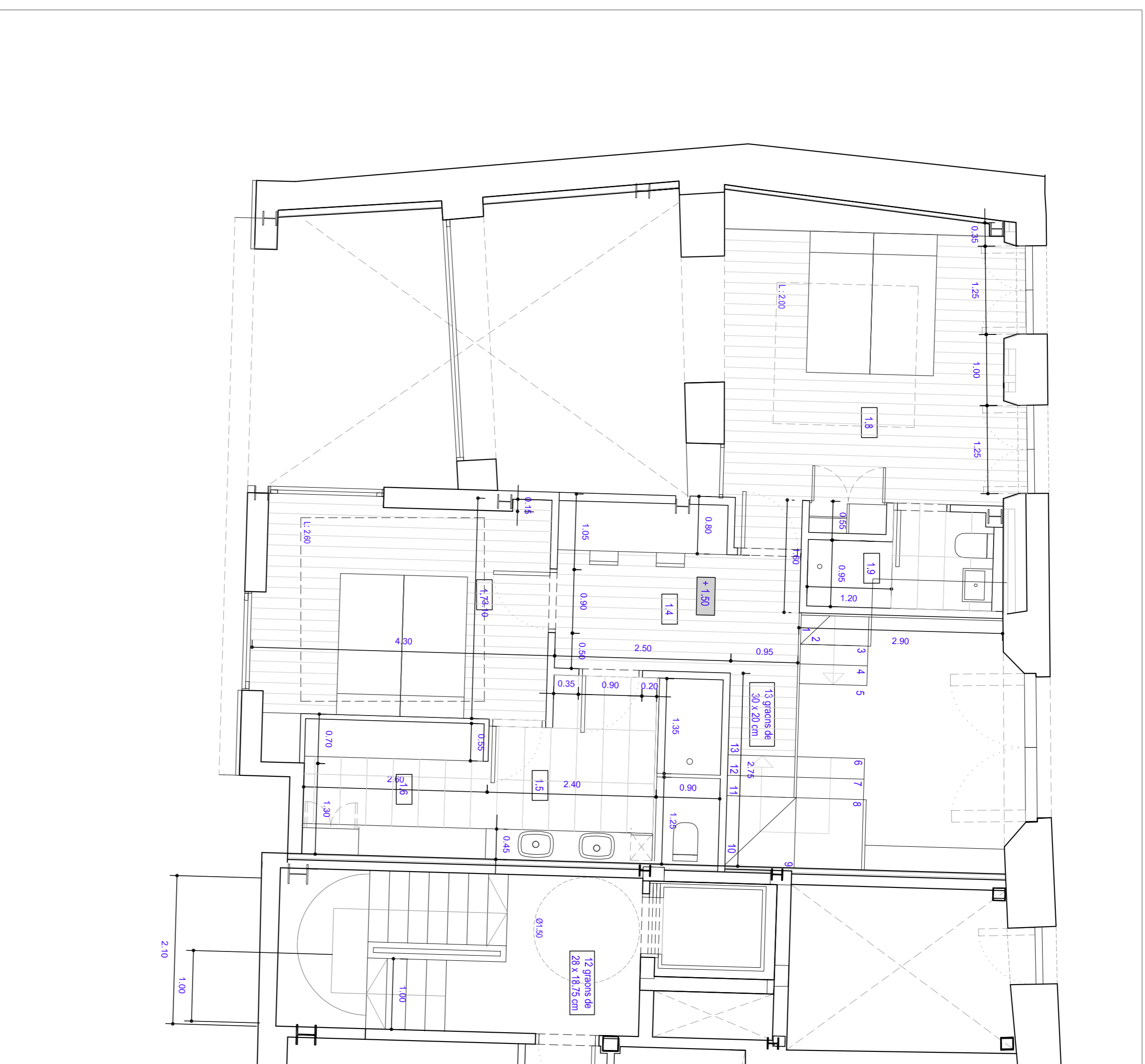
HABITATGE 1. PLANTA ENTRESOL