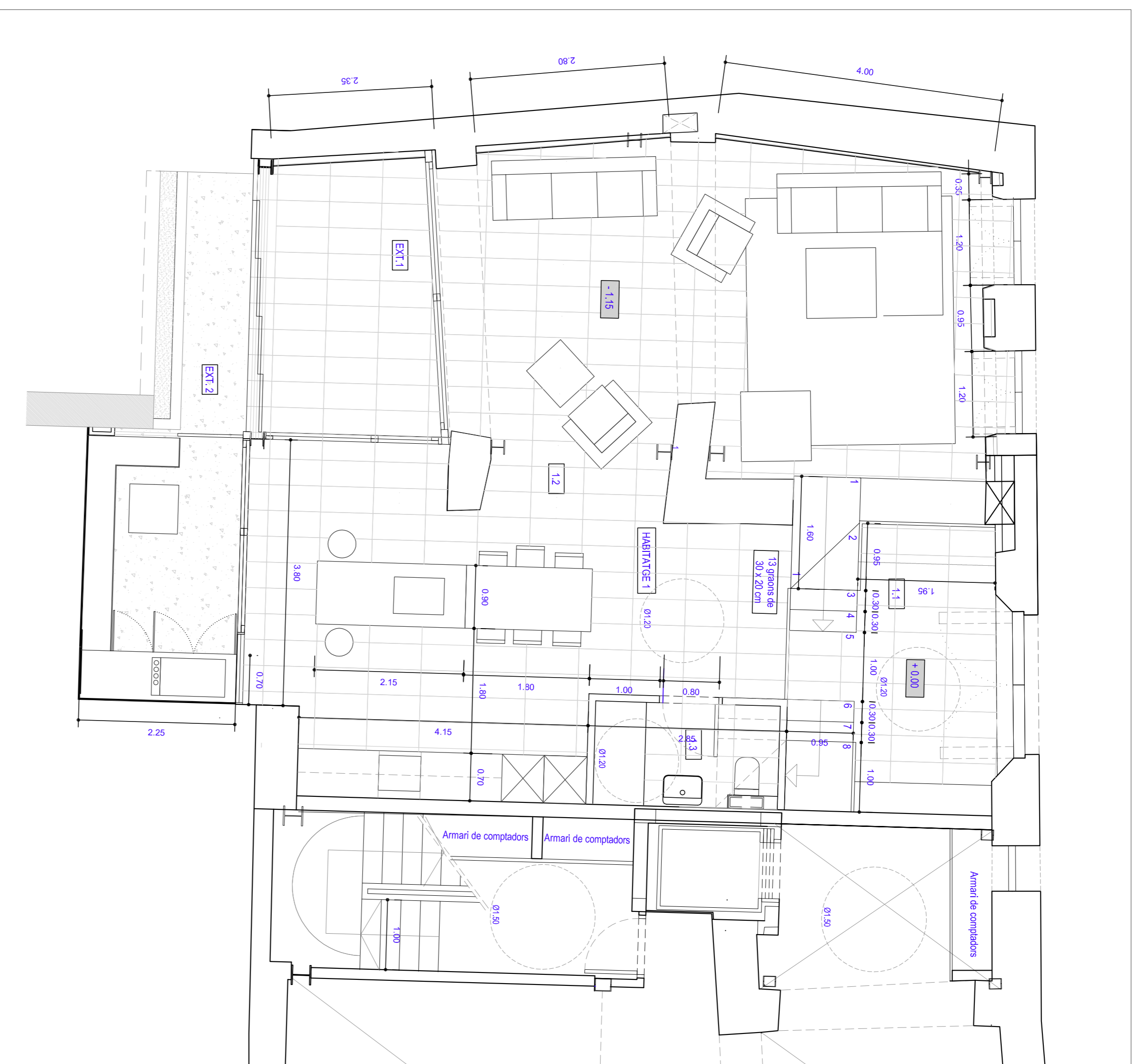
HABITATGE 1. PLANTA BAIXA